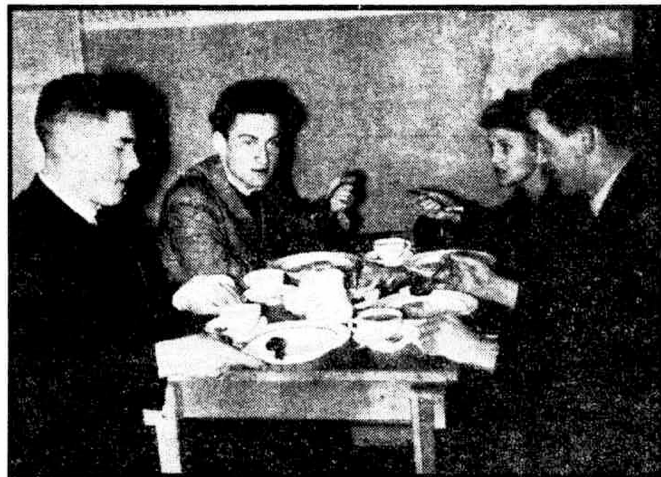
Svenskernes størstedele Hjaelpaktion overfor de danske Flygtninge har været omtalt før, men den kan ikke fremhæves til nok. De fik Klæder, Mad, Penge og Husly i de første vanskelige Dage, og hvor det var muligt, fik de anvist Arbejde. Her har Fotografen fundet et lille Selskab af Flygtninge, som lige efter Aktionen mod de danske Jøder er kommet i sikkerhed og nu faar det første Maaltid Mad paa svensk Grund.