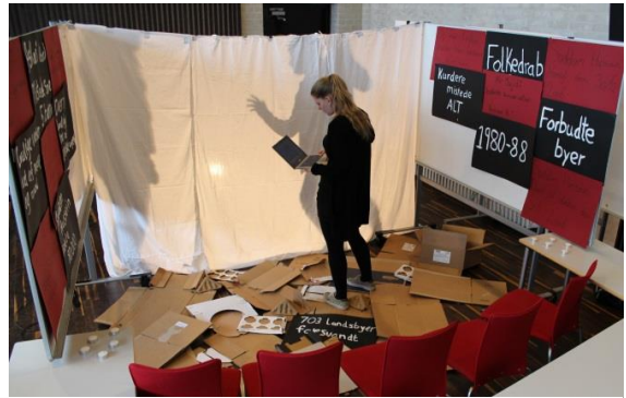
Elever forbereder skyggespil

Næstved laver skyggespillet i det ene hjørne af skolens sal, som denne dag er omdannet til et summende produktionslokale, der minder om en hybrid mellem en tegnestue, et laboratorium og et lokalteater. I løbet af dagen arbejder eleverne i mindre grupper med deres projekter. De bakser med store stykker karton, gamle papkasser, limstifter, farvede spillebrikker, lagener, laptops og lamper for at udføre deres mission: At udvikle et produkt, der fortæller en historie om folkedrab. Spredt rundt i salen arbejder eleverne ivrigt og fokuseret på deres projekter. Internt i grupperne har de mange og til tider ophedede diskussioner om, hvordan produktet helt præcist skal udformes – og ikke mindst hvorfor. Når man snakker med eleverne, er det tydeligt, at deres valg er velovervejede, og at de har diskuteret deres case grundigt. Eleverne er også gode til at tackle, at folkedrab som udgangspunkt er et tungt og alvorligt emne, men at måden at formidle på ikke behøver at være det. Der er ingen berøringsangst, men masser af eftertænksomhed og refleksion.