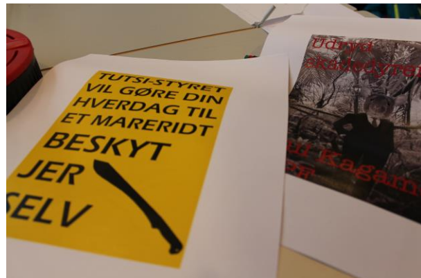
Øverst: Brætspil om folkedrabet i Rwanda og pop-up bog om folkedrabet på Iraks kurdere Nederst: Tegnefilm om Stalins forbrydelser og plakatkampagne om folkedrabet på tutsierne i Rwanda

Der er mange rigtig gode ting at sige om temadagen – og mange grunde til dens succes. Det giver god dynamik, at grupperne er sammensat på tværs af klasser og trin (gymnasie- og folkeskoleelever). Der er høj grad af selvbestemmelse i projektet: Grupperne vælger selv det folkedrab, de vil arbejde med og udvikler deres eget formidlingsprodukt. Det giver ejerskab over processen, hvilket spiller positivt ind på læringen. Det boglige kombineres med det kreative i et anderledes læringsrum, der åbner for nye former for samspil eleverne imellem. Og så er der konkurrenceelementet: Formidlingsprodukterne bedømmes af en dommerkomité. På denne temadag går førstepladsen, i hård konkurrence med andre projekter, til gruppen, der opførte skyggespillet. De leverede en original, bevægende og samtidig saglig fremstilling.